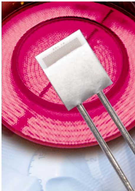
Der HL 220 befindet sich unter dem Cerankochfeld und ist temperaturenbeständig bis 750°C

Und sollte wirklich mal der Sensor ausgetauscht werden müssen, bieten Platinsensoren eine international genormte Kennlinie, ganz gleich von welchem Hersteller. Hauptsache der Widerstandswert passt. Lösungen mit NTCs sind dagegen nicht nur typspezifisch sondern auch herstellerepezifisch. Und wer hat gerade den passenden Typ an Lager?